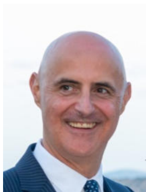
Guillaume Émile-Zola-Place Président