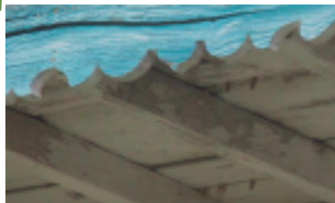
Photo ci-contre : devinez le lieu et la commune où elle a été prise. Envoyez votre réponse avec date, nom, numéro de téléphone ou courriel (coordonnées page 4).