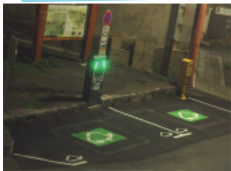
Les 2 places réservées au rechargement des voitures électriques, sur la place de l'Eglise

Massat a donc sa borne de rechargement des voitures électriques ! C'est l'avenir, c'est le progrès, rien que des voitures électriques d'ici 2040 !