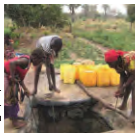
Le puits avant travaux en 2012