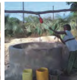
Le même puits en 2014